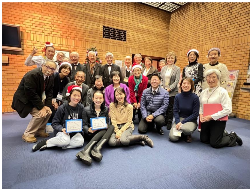
宝塚ワイズとボランティア