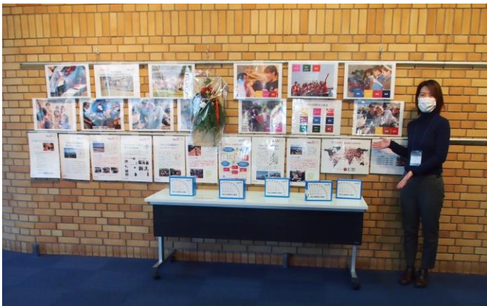
西宮 YMCA の紹介