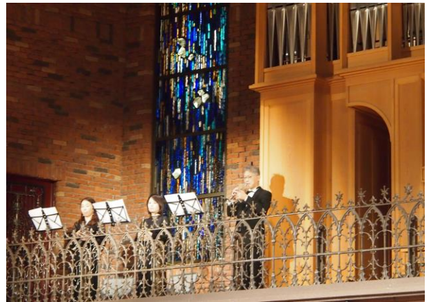
トランペット演奏