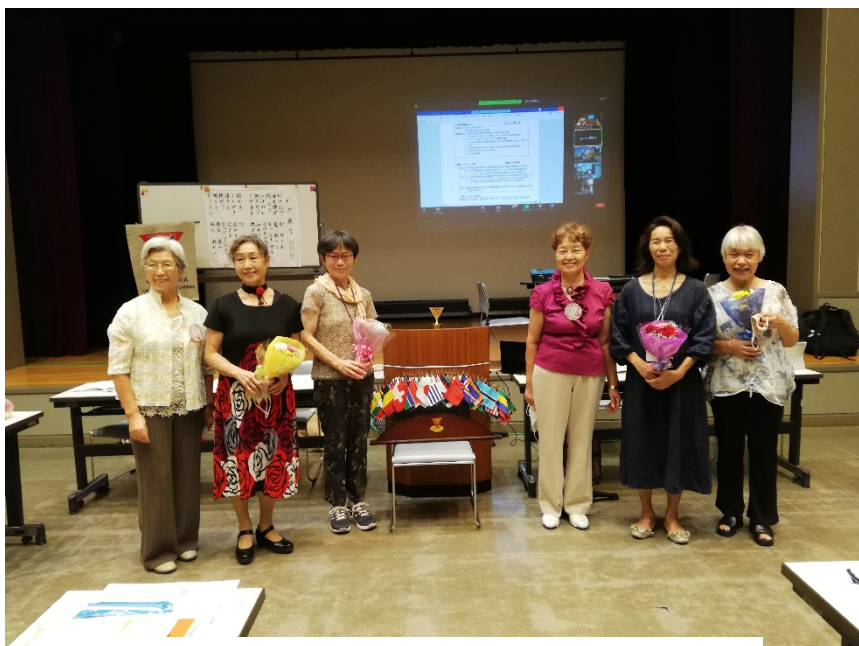
アソシエイトの方々にお花のプレゼント！