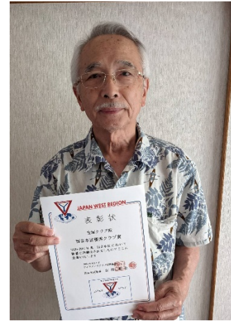
西日本区大会で「優秀クラブ賞」 を受賞しました！