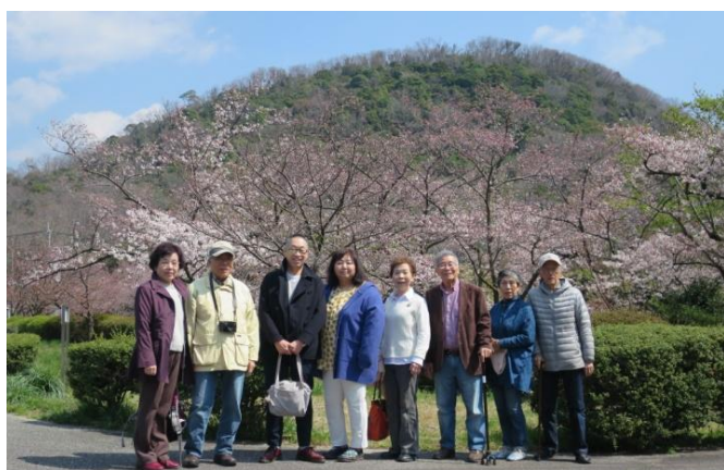
西宮北山ダム(甲山)