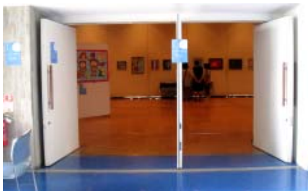
会場入り口 (会場内は撮影禁止でした)

9月27～30日、芦屋市民センターにおいてメネット事業「キラリと輝くアート展」が開催されました。期間中は天候にも恵まれ、大勢の方にご来場頂き、100点以上の力作が、みなさんに大きな感動を与えました。