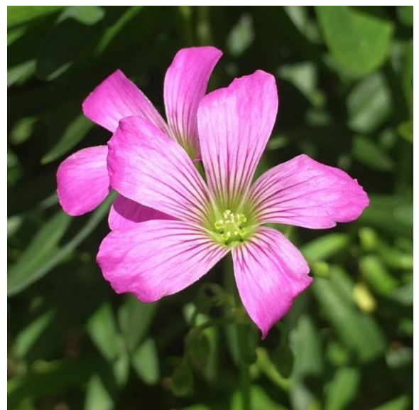
オキザリス ピンク