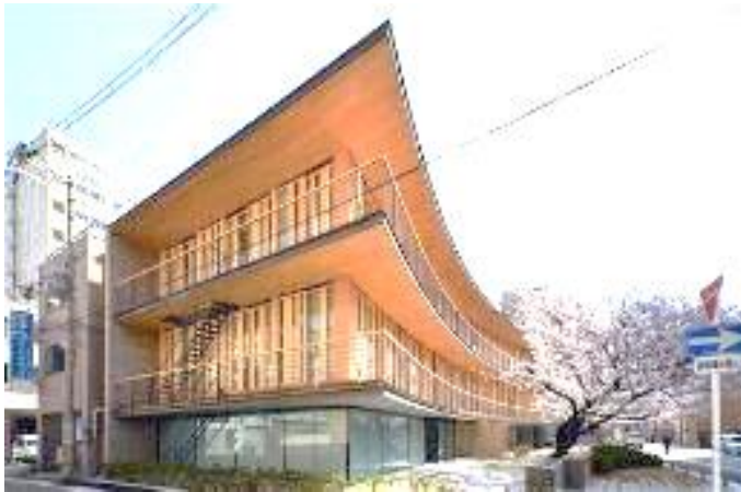
大阪木材仲買会館（大阪市西区南堀江）