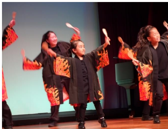
I PRAY 子ども達の踊り