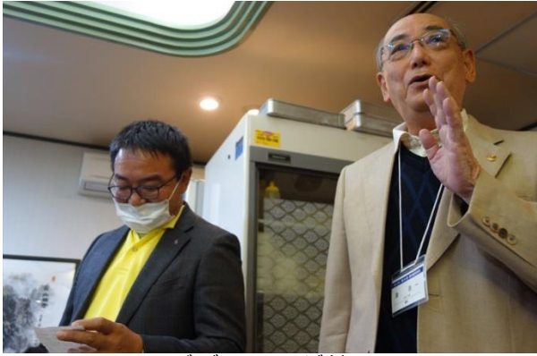
チャイニーズダイニング夢