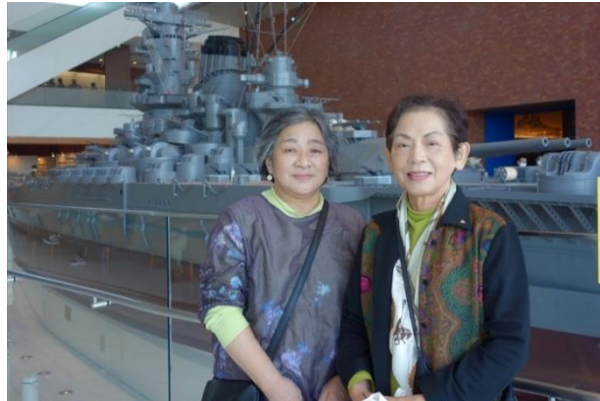
大和ミュージアム