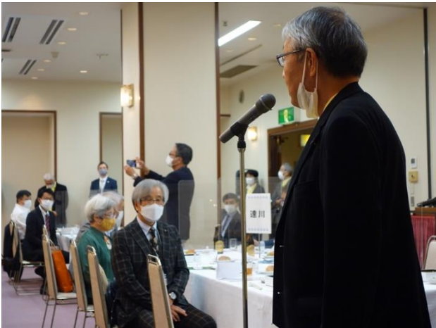
山下広島クラブ会長 懇親会開会挨拶