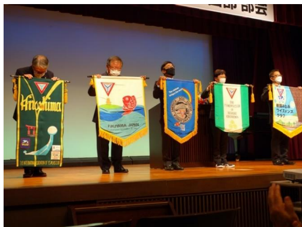
バナーセレモニー