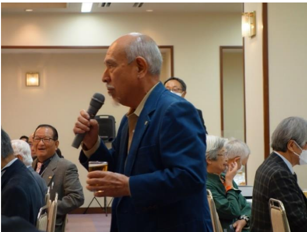
竹本西中国部次期部長 乾杯挨拶