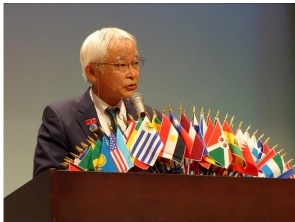
田上西日本区理事 来賓挨拶