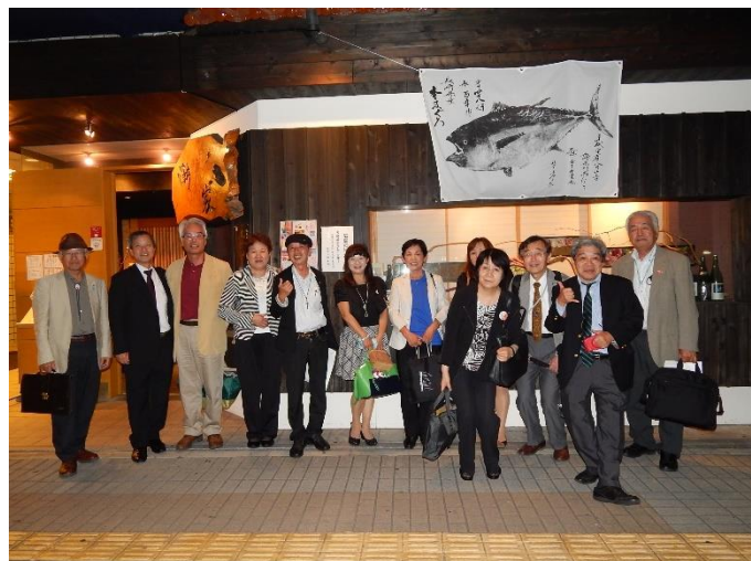
2013 年 9 月 西中国部部会

10 月は例会をさぼり、西中国部部会にのみ参加しました。会場の広島 YMCA は 9 年振り 2 回目の訪問で懐かしかったです。本館はタイルレンガ作りの重厚な建物で特に正面のデザインはすばらしい。9 年前の部会のアーカイブ写真を探してみると、DBC の皆さんとは変わらず和気藹々と交流を楽しんでいます。容姿も多少の経年変化はありますが、そんなには変わってません。コロナのせいかわのせいかわ笑い方が多少控えめになっていると感じるのは気のせいでしょうか？