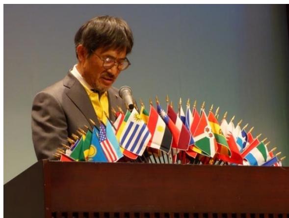
金子西中国部部長 開会挨拶