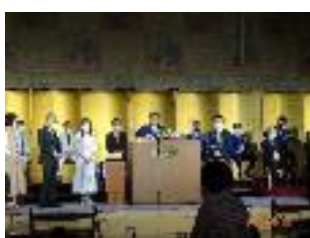
新旧理事引継ぎ式