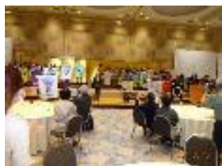
バナーセレモニー