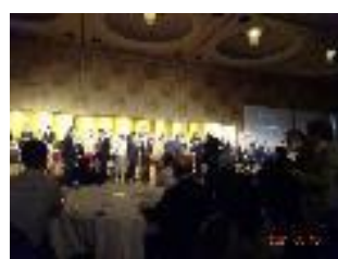
新旧役員引継ぎ式