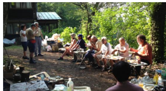
東京むかでクラブ8月例会にて