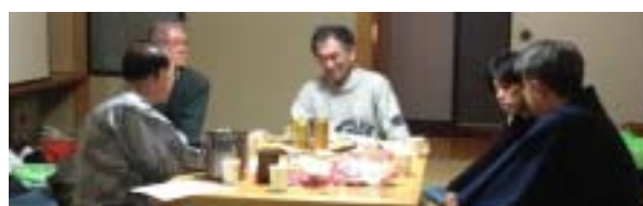
切手切り、食事、懇親のひととき