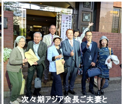
次々期アジア会長ご夫妻と

5時からは馴染みの「やっちゃい」で遠方からの来客を囲んでの打ち上げが持たれ、大いに盛り上がりました。