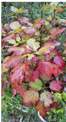
柏葉アジサイの紅葉