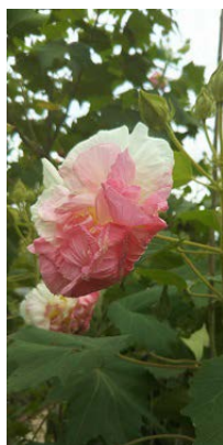
酔芙蓉(スイフヨウ)