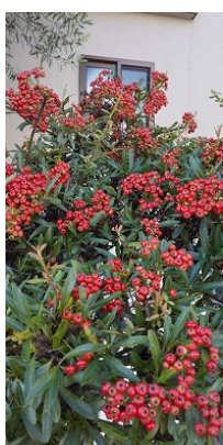
ピラカンサの赤い実