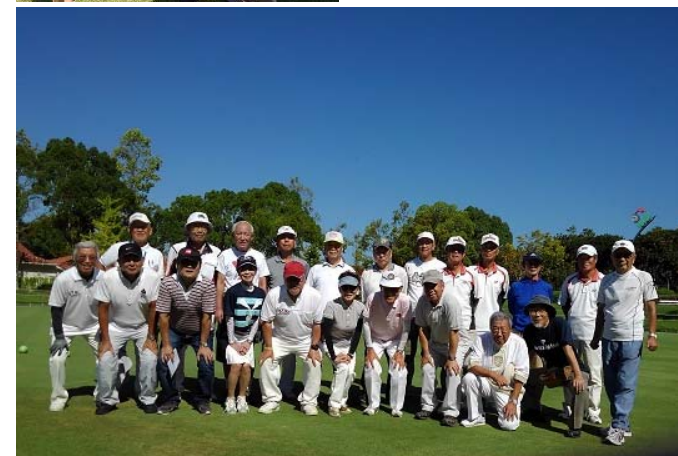
雲一つない青空のもとで