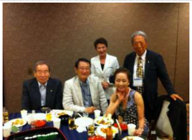
懇親会場で、都筑会長はパナーセレモニーを終えてリラックス 上野メンは翌日の部長交代式の大切なお役目が残っています