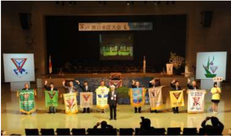
恒例のパナーセレモニー、芦屋クラブのパナーは立派ですね