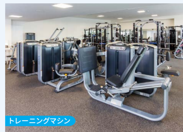
トレーニングマシン