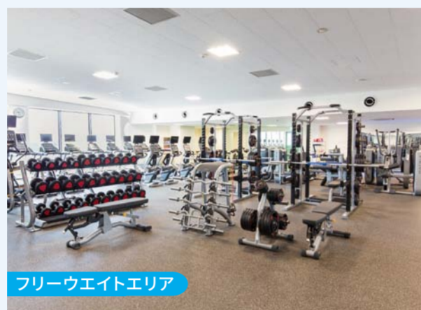
フリーウエイトエリア