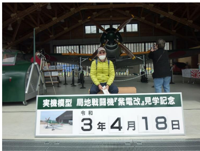
(写真は加西市鶉野町 鶉野飛行場跡)