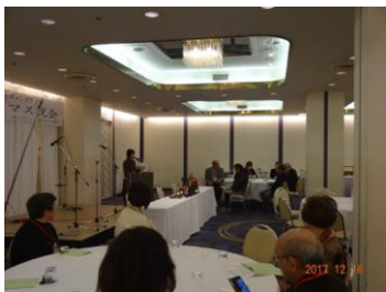
クリスマス例会風景