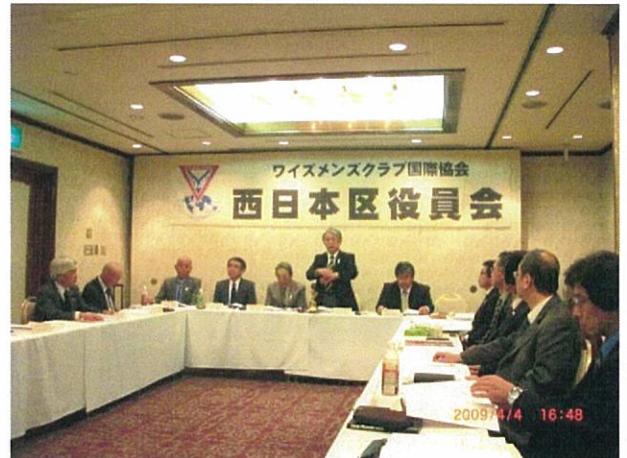
09-10 第1回準備役員会（2009. 4. 4-5）Hクライトン新大阪◇直近の行事