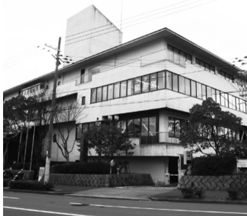
北須磨文化センター外観

小学校や大学等の教育機関や北須磨地区の自治会との関係を深め、センターとつながっているお一人おひとりの人生が豊かになることを目指して「Design For Life」を合言葉に日々の運営に尽力していきます。