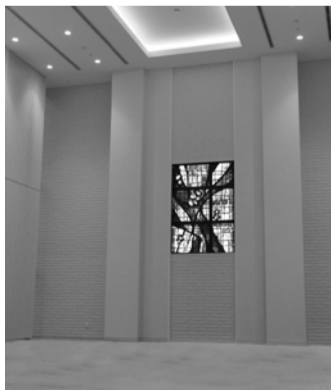
2階チャペル内正面には スタンドグラスが設置されています。

この三宮会館は、地上11階建て、1~3階部分は神戸YMCA学院専門学校(ホテル学科・日本語学科)、ランゲージセンター、国際奉仕、地域サービス、チャペル、本部機能が、4~11階は、協働事業者「(株)生活科学運営」による高齢者の方の入居住宅(介護付有料老人ホームを含む)「ライフ&シニアハウス神戸北野」となります。