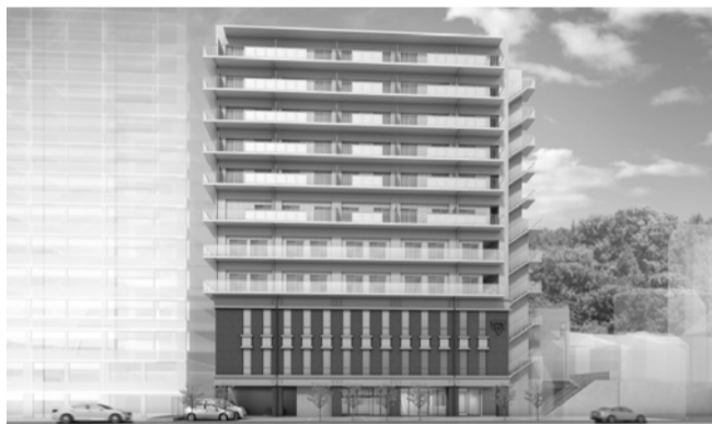
東側からの全景です。

建築募金は2017年12月末までとなっています。今後も更なるご支援、お力添えを何卒よろしくお願ひ申し上げます。