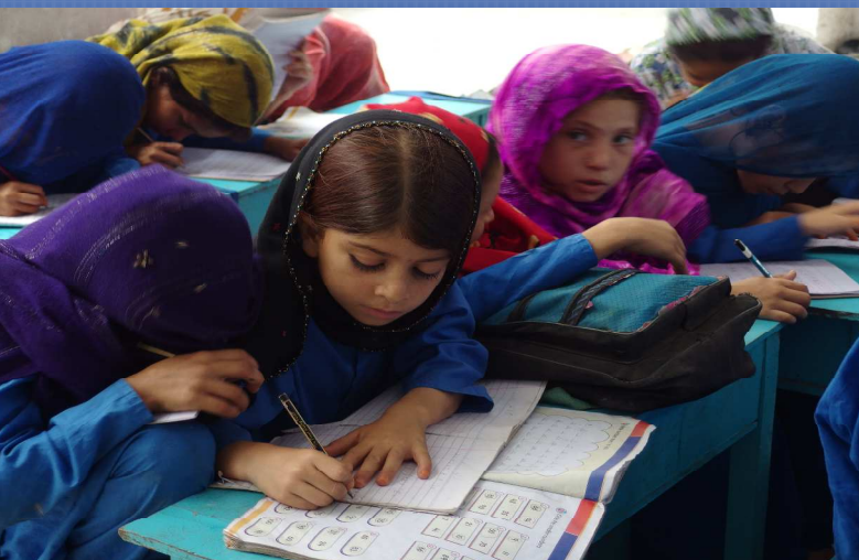
アフガニスタン難民の子どもたちへの教育支援