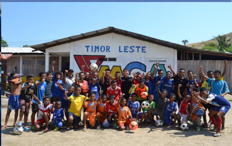
東ティモール YMCA での教育支援

YMCA国際協力募金は、世界119の国と地域に広がるYMCAのネットワークを通じて、すべての人々が国・民族・宗教の違いを超え、平和にいきいきと暮らすことができる世界を創りだすための国際協力・国際奉仕活動に用いられています。